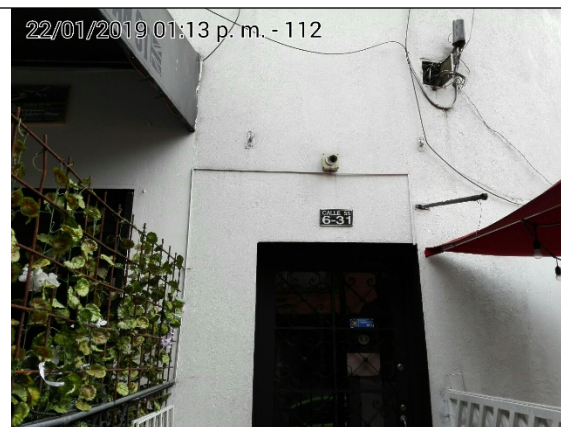
FOTOGRAFÍA N°. 2 NOMENCLATURA DEL PREDIO