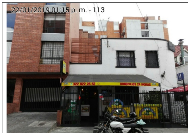
FOTOGRAFÍA N°. 1 FACHADA DEL PREDIO